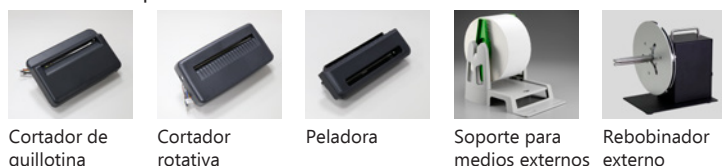
Cortador de guillotina